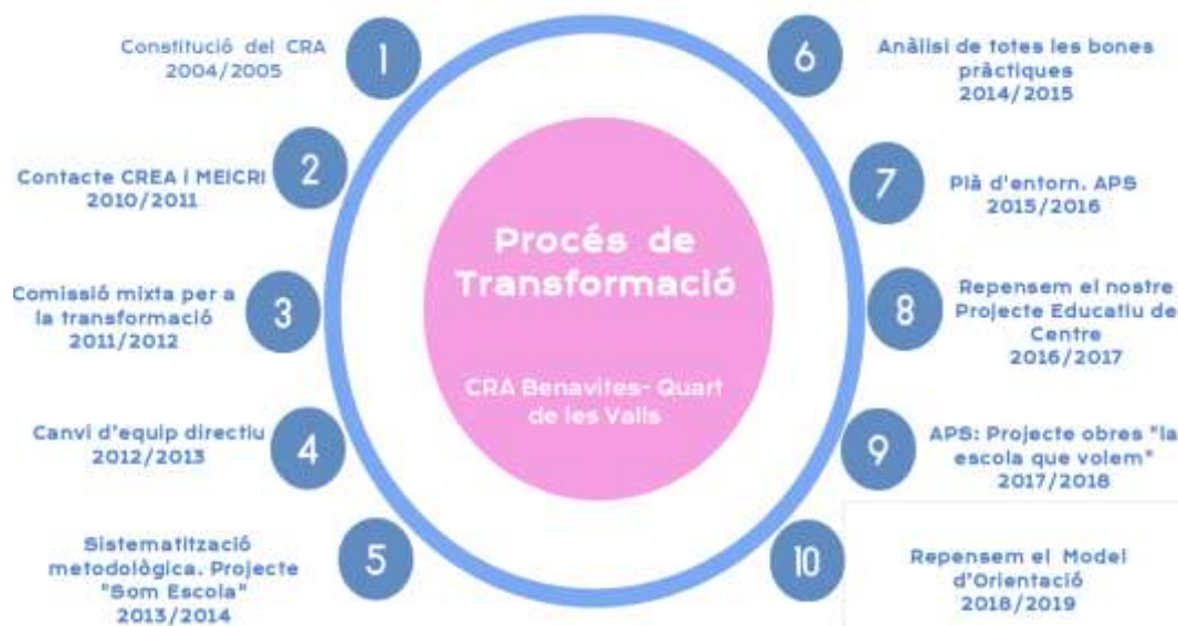
Imatge 7. Procés de transformació del CRA Benavites-Quart de les Valls des de l'any 2004, fins a l'actualitat.

A la següent imatge es recullen les Fases de la transformació que el CRA Benavites - Quart de les Valls des de l'any 2004 fins a l'actualitat. Un procés que no acaba i que sempre està en contínua avaluació.