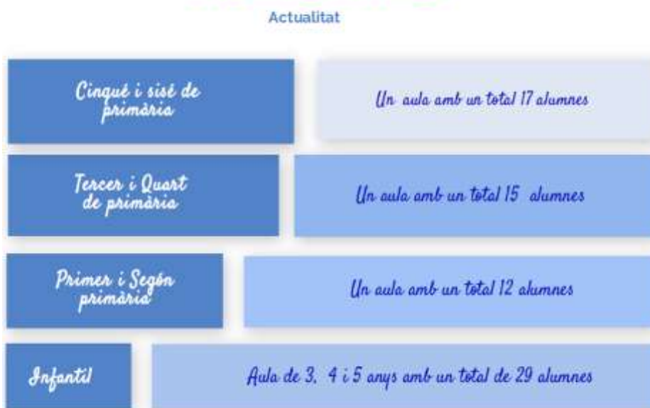
Imatge 9 . Estructura actual dels dos aularis

Un camí llarg, però emocionant i intens, un camí ple d’emocions i aprenentatge, un camí amb alguna pedra que s’ha anat esquivant amb esforç i treball, en definitiva, un camí que mai acaba, perquè s’estarà contínuament aprenent i creixent com a centre.