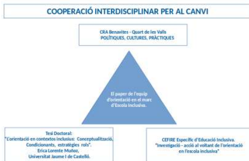
Imatge 11 Triangulació de la cooperació interdisciplinària.

Per tant, els nous reptes del CRA passen per aquesta triangulació: