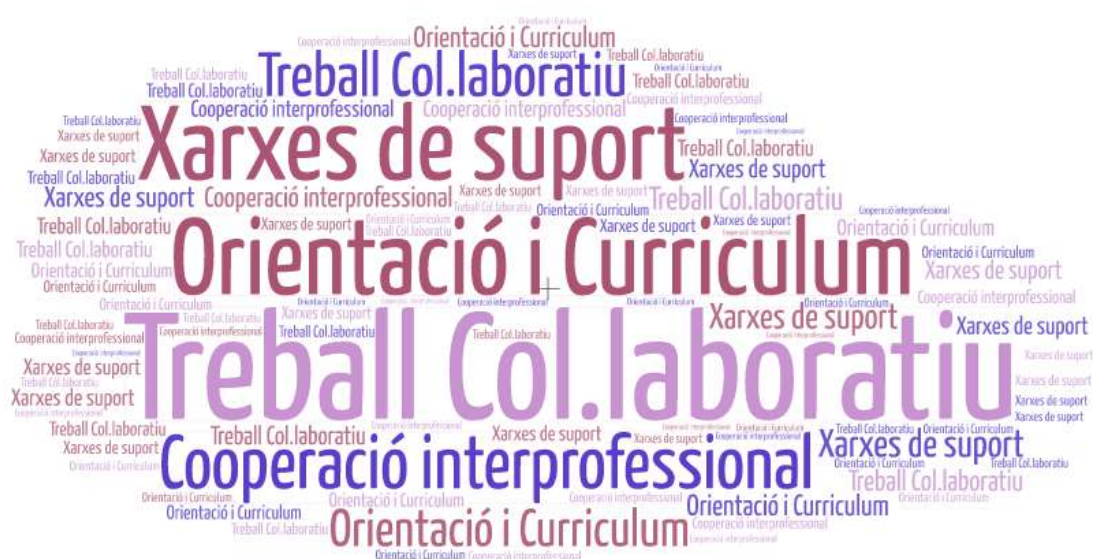
Imatge 12. Idees força que fonamenten el canvi.

A partir d'aquestes cites sorgeixen unes idees força que es representen mitjançant aquestes paraules clau: