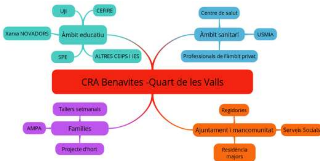
Imatge 3. Agents de col·laboració amb els que treballa el CRA Benavites -Quart de les Valls.