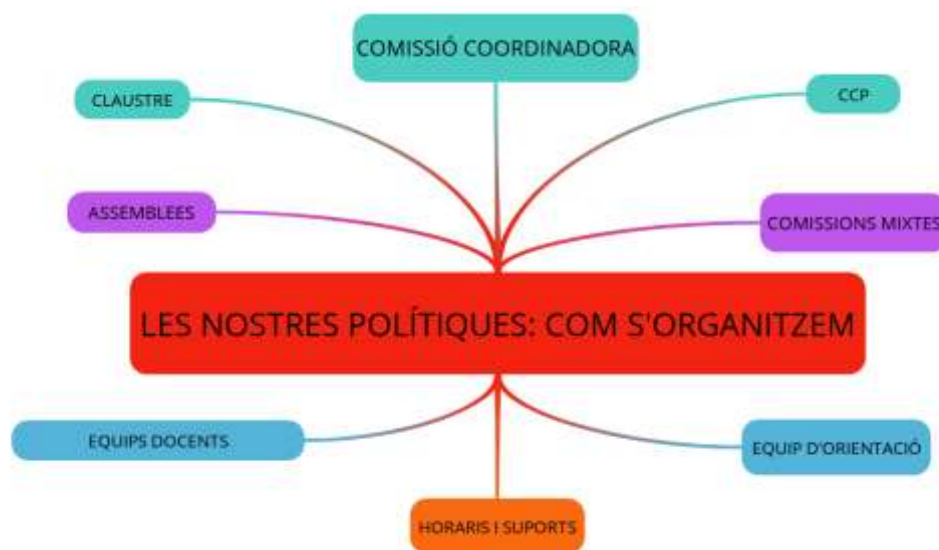
Imatge 4 Les polítiques, l'organització del CRA Benavites - Quart de les Valls.