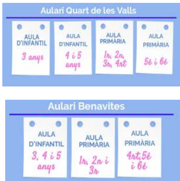
Imatge 8 Estructura inicial dels dos aularis.

materials i econòmics principalment. Per aixó va sorgir la necessitat de formar un centre rural agrupat l'any 2004. Cal afegir, que es comptava amb un nombre molt baix d'alumnes i unes ràtios baixes. Tenint la majoria de cursos agrupats als 2 aularis, no s'arribava a tenir 130 alumnes abans de la constitució del CRA. Les dos taules següents mostren l'estructura que hi havia establerta: