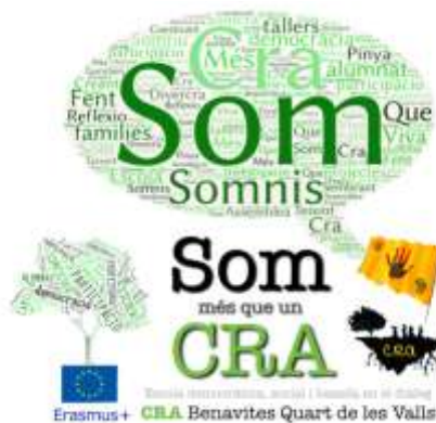
Imatge 2. El nostre logotip