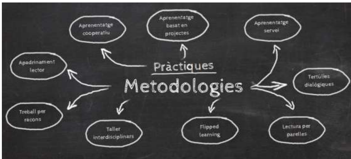
Imatge 5. Pràctiques metodològiques que s'utilitzen al CRA Benavites – Quart de les Valls.

La tecnologia és un altre aspecte important en el centre: ordinadors, tauletes i Ipads formen part del dia a dia de l'aula.