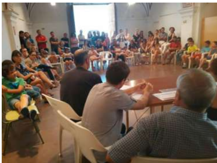
Imatge 6. Taller de participació ciutadana, presentant inquietuds dels regidors.

Pel que fa a l'avaluació de les pràctiques, cada any es reflexiona i s'avaluen les pràctiques educatives. Es fa de diverses formes amb ajuda de dinàmiques participatives i utilitzant l'acció - participació de tots els actors i dels elements que participen de les mateixes.