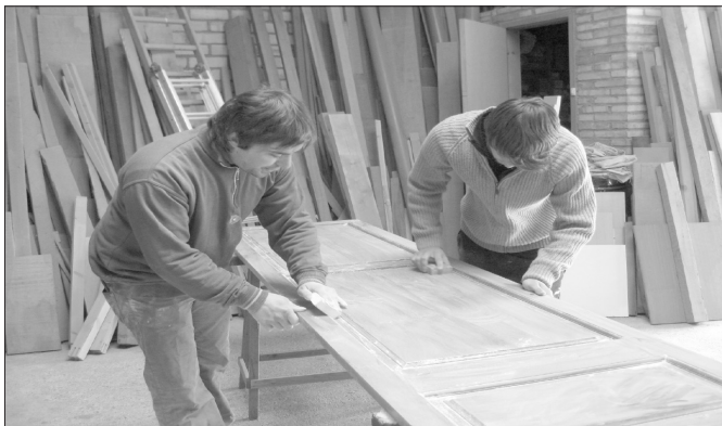
(Fotografia d'un alumne fent pràctiques en una empresa de fusteria)

Reunió final: la valoració de l'assoliment dels objectius es portarà a terme amb la puntuació de 0 a 10 dels ítems que queden recollits en un butlletí específic.