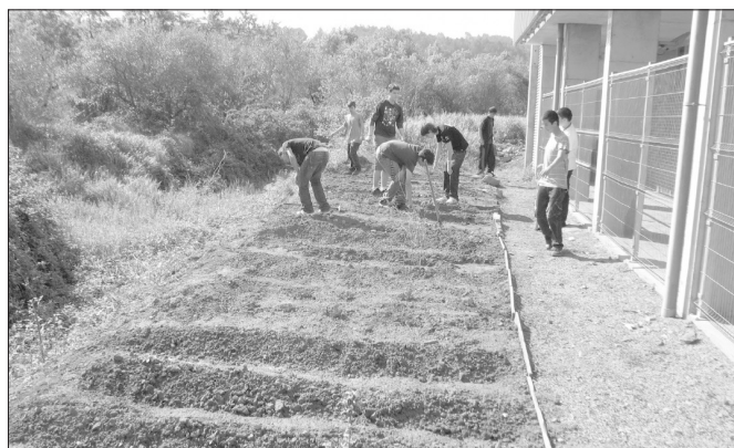
(Fotografia dels alumnes a l'hort. Matèria optativa de 4t)