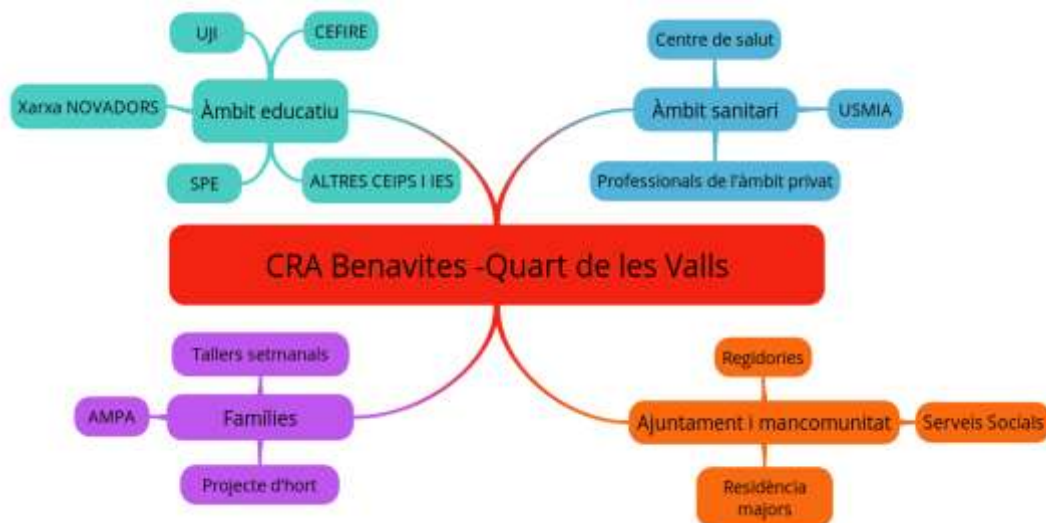
Imagen 3. Agentes de colaboración con los que trabaja el CRA Benavites -Quart de les Valls.