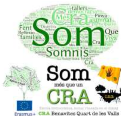
Imagen 2. Nuestro logotipo