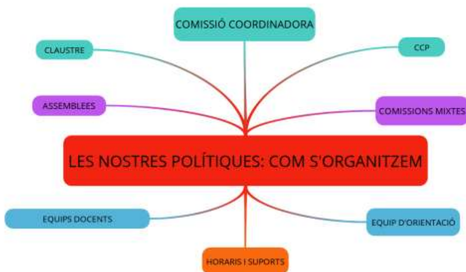
Imagen 4 Las políticas, la organización del CRA Benavites - Quart de les Valls.