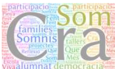
Imagen 1. Logo Somos Centro Rural Agrupado.

Este es uno de los indicadores de éxito del proyecto educativo, que refuerza y anima al equipo docente a continuar trabajando en esta línea innovadora.