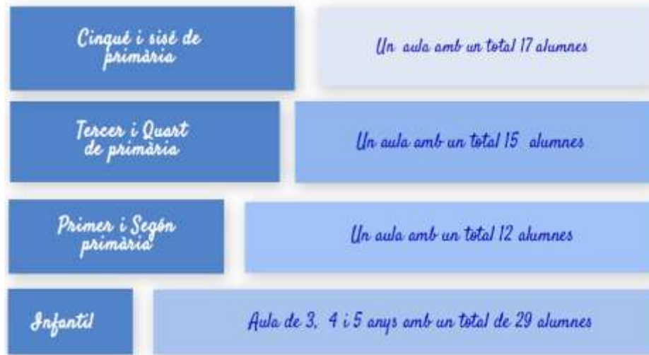
Imagen 9. Estructura actual de los dos aularios

Un camino largo, pero emocionante e intenso, un camino lleno de emociones y aprendizaje, un camino con alguna piedra que se ha ido esquivando con esfuerzo y trabajo, en definitiva, un camino que nunca acabará, porque se estará continuamente aprendiendo y creciendo como centro.