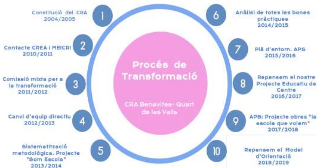
Imagen 7. Proceso de transformación del CRA Benavites - Quart de les Valls desde el año 2004, hasta la actualidad.

En 2004 hablamos de una escuela rural, en un pueblo pequeño. Caracterizada por aulas pequeñas, grupos interniveles y mucha inestabilidad de la plantilla principalmente a las especialidades, con carácter itinerante, que dependía de las unidades volátiles de la escuela rural.