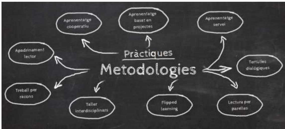
Imagen 5. Prácticas metodológicas que se utilizan al CRA Benavites – Quart de les Valls.

En muchas ocasiones se preparan actividades que son iniciadas en casa (a partir de ver videos, leer artículos, compartir actividades, etc.) y son continuadas en clase después del trabajo previo hecho con la familia en casa.