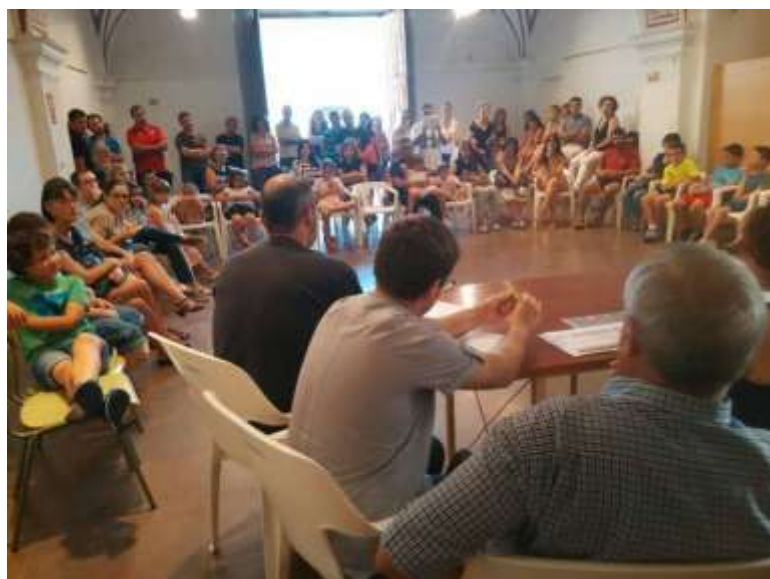
Imagen 6. Taller de participación ciudadana, presentando inquietudes de los regidores.

A final de curso estos espacios se abren para reflexionar y compartir lo que se hace con el claustro, con los formadores y si procede también con la comunidad educativa. La intención de los profesionales del CRA siempre es recoger más observaciones además de las del claustro para mejorar las metodologías y conseguir cada vez ser más inclusivos, además de democráticos. En las dinámicas participan todas las voces de la comunidad educativa y se hace una valoración final a la comisión coordinadora.