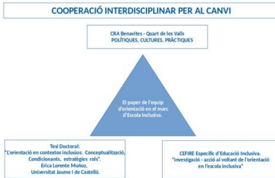
Imagen 11 Triangulación de la cooperación interdisciplinar.

Con este trabajo cooperativo y colaborativo, se trata de cuestionar el modelo de orientación reflexionando alrededor de los siguientes interrogantes: