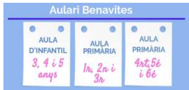
Imagen 8 Estructura inicial de los dos aularios.

Al formar el CRA se empezó a ser un centro completo. Esto permitió establecer unos especialistas compartidos entre aularios de forma definitiva y un claustro bastante estable con un gran porcentaje de maestros definitivos. Es en este momento empieza el proceso de cambio y de transformación. Proceso que ha marcado un antes y un después en el centro, en las aulas y en los pueblos.