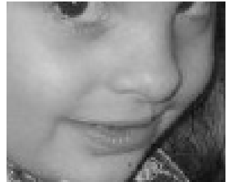
La mateixa nena amb 3 anys

logopeda, tractament d'ortodòncia i teràpia psicològica. La quantitat d'operacions dependrà de diversos factors, com per exemple de si la fissura és només de llavi o també de paladar, i de l'equip que faci les operacions.