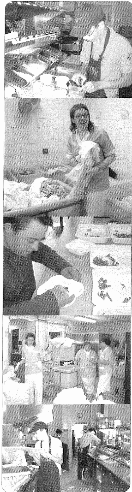
Alumnes realitzant pràctiques