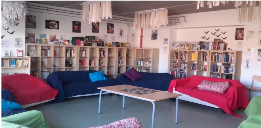
(Foto 6. Aula Matilda, on es va gravar el programa "Trenta Minuts"[10])

Un fet afegit d'aquest curs 2015/16 fou que vaig ser l'única professora que només tenia càrrega docent a quart d'ESO, ja que els altres companys feien docència a diferents nivells. Això va fer que coincidís diàriament amb les quatre línies de quart, bé a l'aula, bé al passadís, i que es convertís en, pràcticament, una convivència diària molt intensa, plena de històries de vida, unes més agradables i d'altres menys. Com a resultat, alguns alumnes van demanar verbalment i per escrit a direcció que continués amb ells com a tutora a Batxillerat.