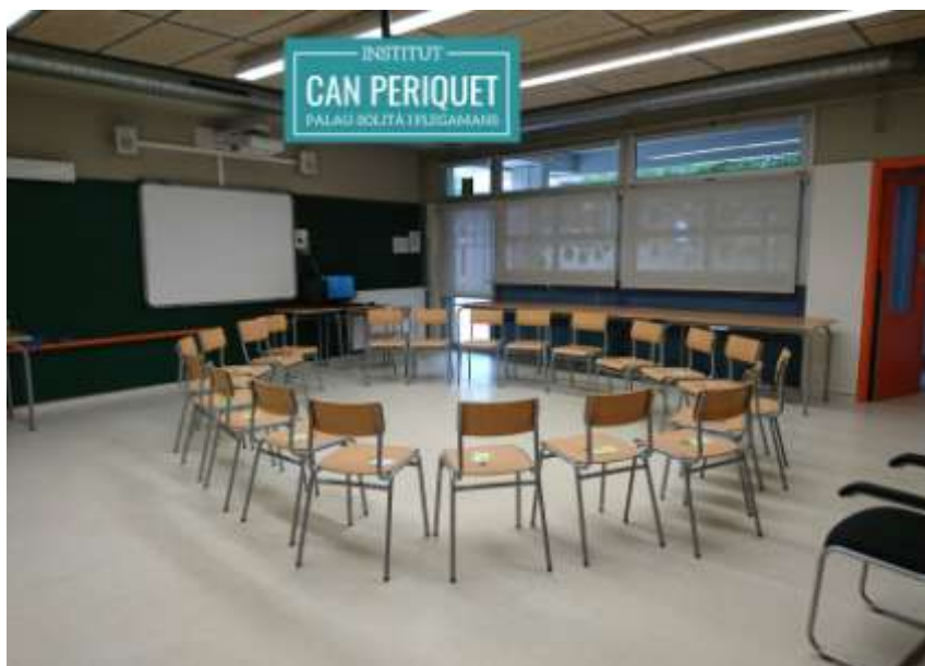
Imatge 3. El cercle.

M'agradaria acabar aquest article amb una frase de Martin Luther King extreta del seu discurs del 28 d'agost de 1963 que diu: “Hem après a volar com els ocells, a nedar com els peixos, però no hem après a viure com humans” . M'agradaria respondre-li que estem en el camí. Que nosaltres els docents, les famílies i també les institucions tenim l'obligació d'esforçar-nos per fer dels nostres centres educatius uns espais per viure i conviure desenvolupant la cultura de la pau.