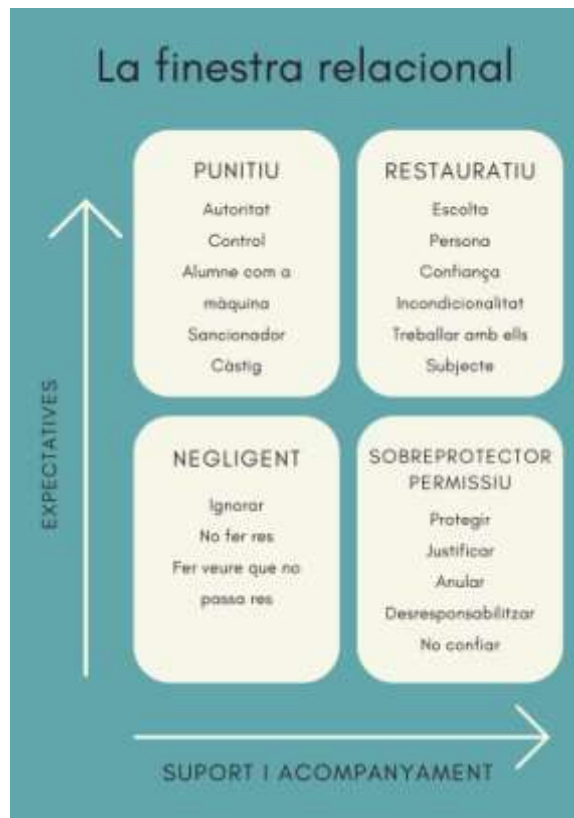
Imatge 1. Finestra relacional.