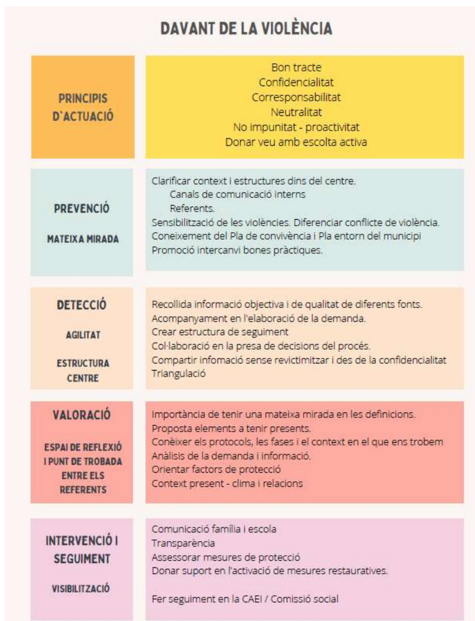
Figura 4. Infografia abordatge violència centres educatius..