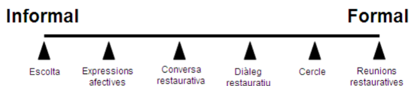
Figura 2. Continuïum pràctiques restauratives (Adaptat a partir de T.Wachtel)

Les pràctiques restauratives inclouen diferents propostes, de més informals a més formals. L'IIRP es proposa un repertori que es podria ubicar en un continuu, el seu ordre aniria des del més senzill i informal a més formal, complex i destinat al tractament d'assumptes més seriosos. Aquest conjunt de pràctiques restauratives o continuu es mostra a la figura 2.