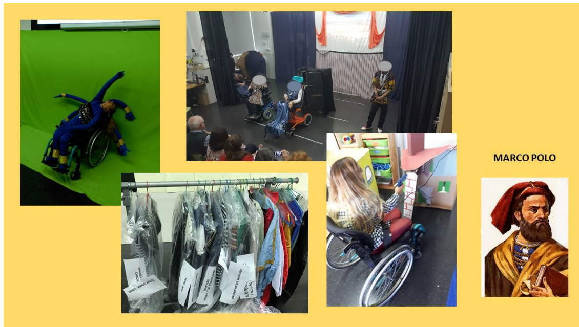
Foto 2. Els quatre tallers.

A continuació detallam a través de la taula n.2, competències i objectius dels quatre tallers que es posen en funcionament al novembre amb dues sessions setmanals. Atenent sempre a la diversitat funcional dels nostres alumnes que sovint al llarg de l'activitat precisen de: canvis posturals, hidratacions, canvis higièncics,... Les competències ressaltades són les que s'han prioritzat en els diferents tallers.