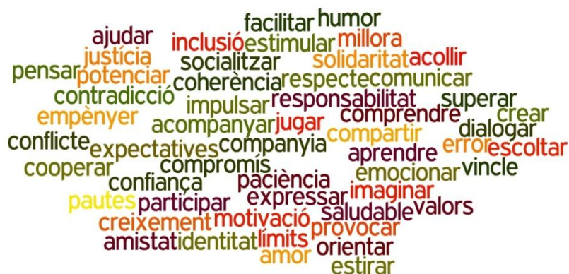
(Figura 1. Possibles accions vinculades a l'acció d'Educar.)

Aquest trident té i tindrà repercussions en l'àmbit econòmic, laboral, comunicatiu, familiar, acadèmic... Educativament parlant, estem davant de grans oportunitats formatives, alhora que de grans desigualtats cognitives quan desconeixem com ens poden ajudar a desenvolupar-nos. Ens ofereix grans avantatges pel que fa a l'accés a moltes fonts d'informació, a la construcció i gestió de coneixement, alhora que el podem compartir de forma més fàcil i eficient amb d'altres persones d'arreu del món. Per contra, hem de tenir cura de la seguretat, la privacitat de les nostres dades i ser consumidors crítics davant de tants mitjans que tenim a l'abast (Jubany, J., 2016).