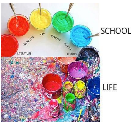
(Figura 4. Metàfora visual entre matèries a l'escola i experiència vital.)

No és un camí fàcil perquè és nou per a tots, alumnes, centres i famílies. Tots podem aprendre i, a més, fer-ho plegats. Podem ajudar-nos a aprofitar justament aquesta nova situació per construir vincles significatius per educar-nos en aquest món connectat on ens ha tocat viure. Un entorn complex i canviant que modifica la percepció de l'espai i el temps. Un escenari en el que ara eduquem i on nosaltres no vam ser educats.