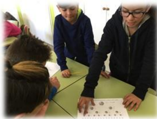
(Foto2. Situacions problema)